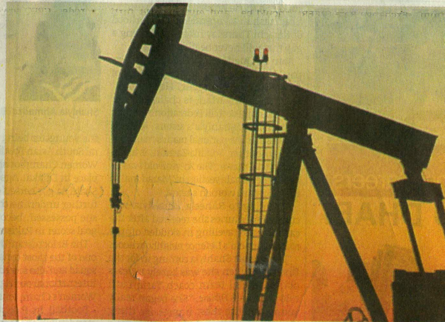
REASONS: The management attributed the highest-ever crude oil production to increased focus on project completion, work-over jobs and development activities.

The management attributed the highest-ever crude oil production of 48,767 barrels per day to increased focus on project completion, work-over jobs and develop-